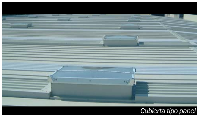
Cubierta tipo panel

Se trata de un elemento de iluminación ideal que se adapta perfectamente a cubiertas tipo DECK y a cubiertas tipo panel.